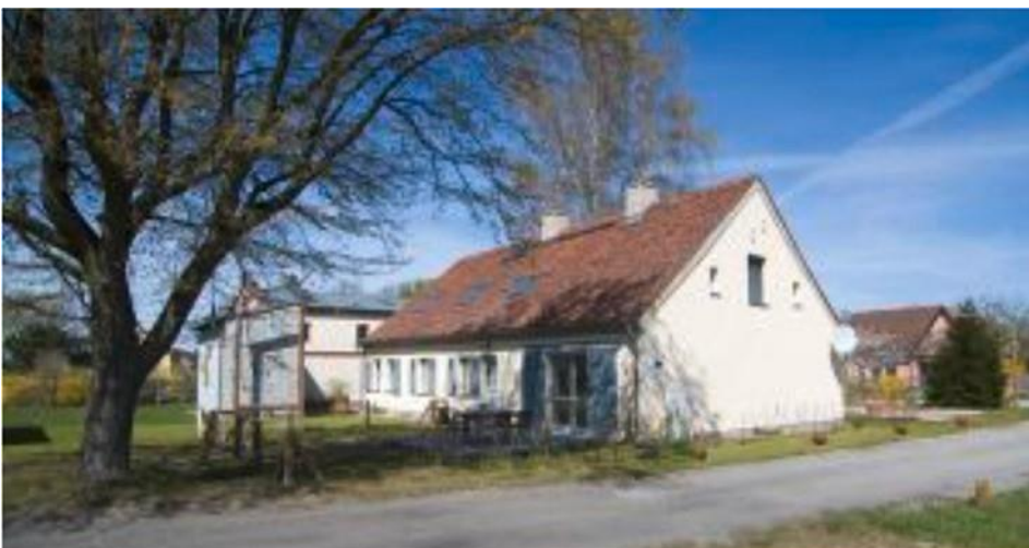
Doppelhaus "Watvogel" 11 und "Waschbär" 11