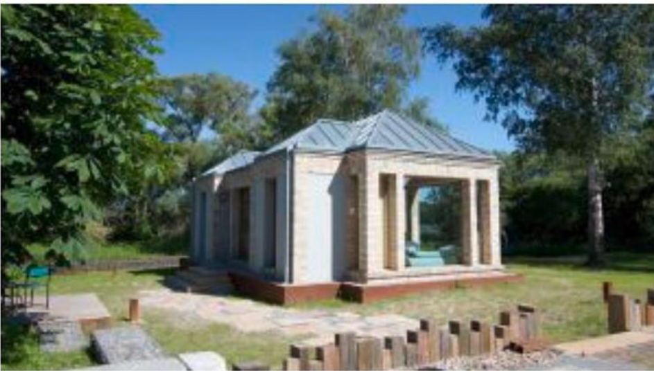
Haus "Seepavillon" 11