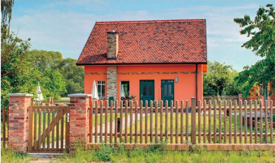
"Rotes Gästehaus" 11

Die Gegend bietet viele Möglichkeiten für Ferienaktivitäten, zahlreiche Sehenswürdigkeiten befinden sich in der Nähe. Die Ferienwohnungen können Sie unter www.fewo-direkt.de buchen.